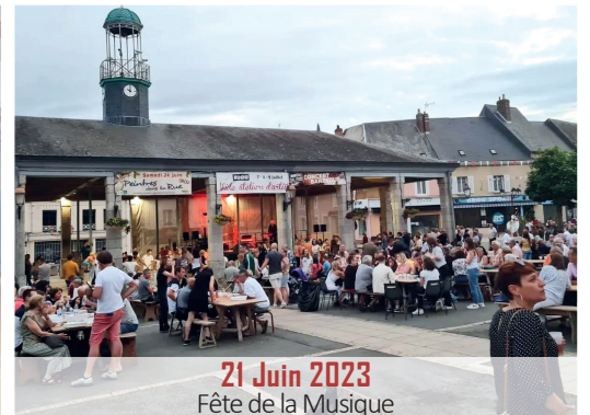
21 Juin 2023 Fête de la Musique