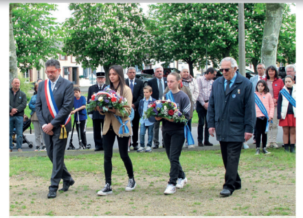
8 mai 2023 Commémoration du 8 mai 1945