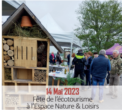
14 Mai 2023 Fête de l'écotourisme à l'Espace Nature & Loisirs