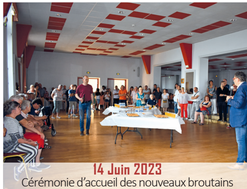
14 Juin 2023 Cérémonie d'accueil des nouveaux broutains