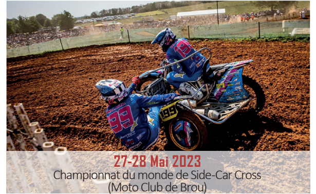
27-28 Mai 2023 Championnat du monde de Side-Car Cross (Moto Club de Brou)