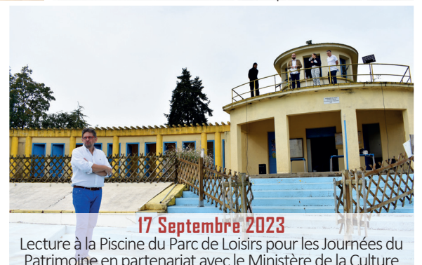
17 Septembre 2023 Lecture à la Piscine du Parc de Loisirs pour les Journées du Patrimoine en partenariat avec le Ministère de la Culture