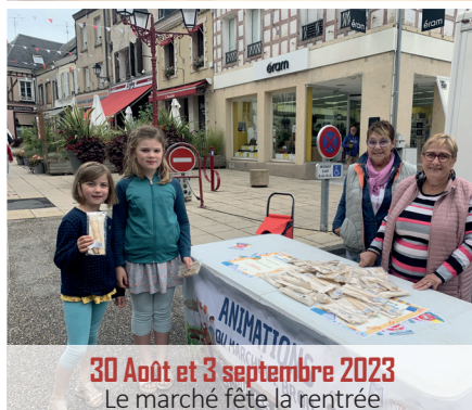
30 Août et 3 septembre 2023 Le marché fête la rentrée