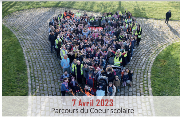
7 Avril 2023 Parcours du Coeur scolaire