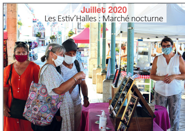
Juillet 2020 Les Estiv'Halles : Marché nocturne