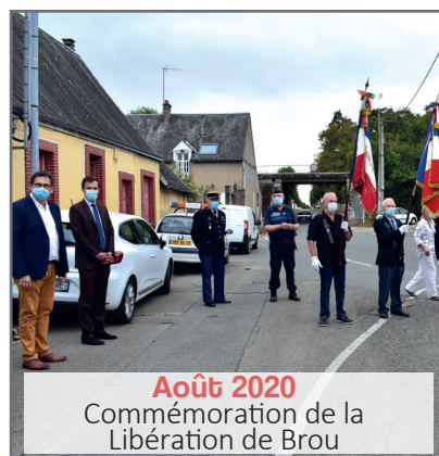
Août 2020 Commemoration de la Libération de Brou