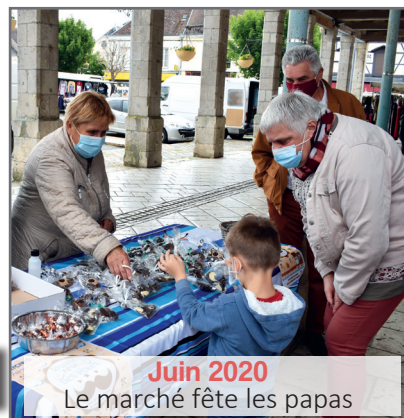
Juin 2020 Le marché fête les papas