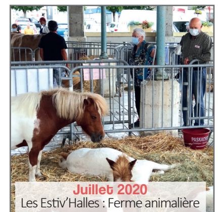
Juillet 2020 Les Estiv'Halles : Ferme animalière