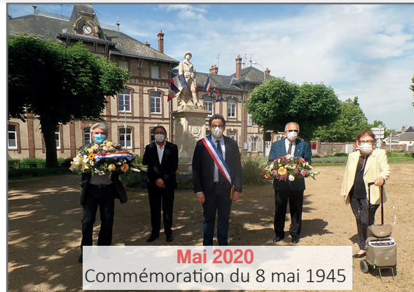
Mai 2020 Commemoration du 8 mai 1945