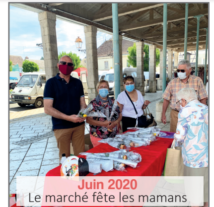
Juin 2020 Le marché fête les mamans