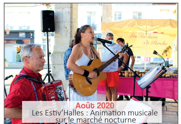
Août 2020 Les Estiv'Halles : Animation musicale sur le marché nocturne