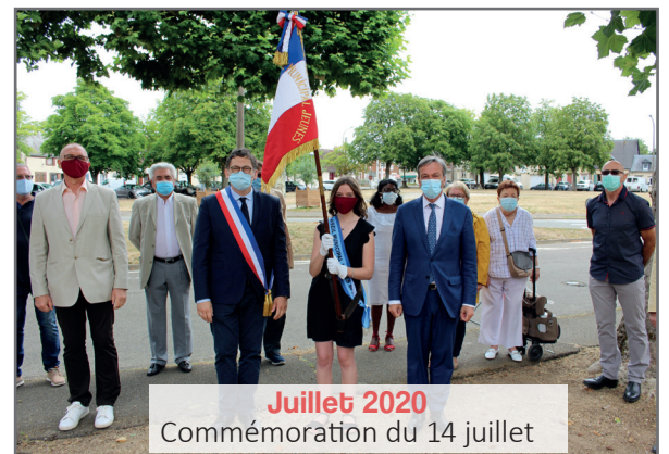
Juillet 2020 Commemoration du 14 juillet